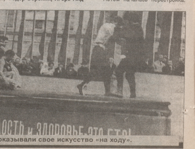
На демонстрациях борцы показывали свое искусство «на ходу».

В СССР начали развивать вольную борьбу в основном потому что она входила в олимпийскую программу. Тон здесь задавали спортсмены из Азербайджана, Армении и Грузии, потому что их национальные виды борьбы имели много общего с техникой международной вольной борьбы. Большим поклонником этого вида спорта был Сталин, который внимательно следил за первыми международными выступлениями советских борцов.